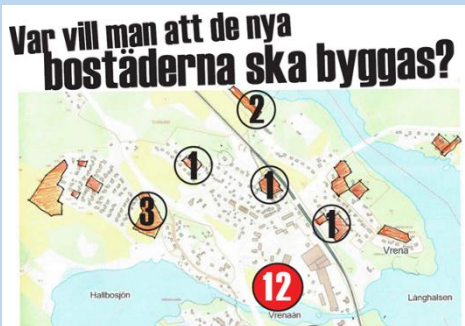
Bild från LEader Sörmlandskustens hemsida